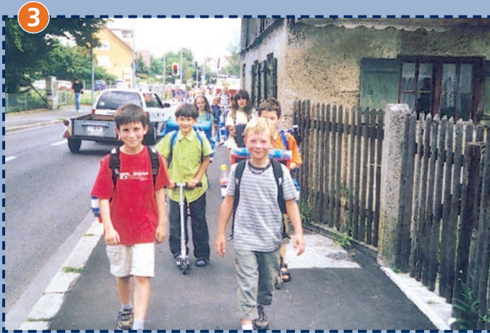
Fußweg neben der Forstenrieder Allee