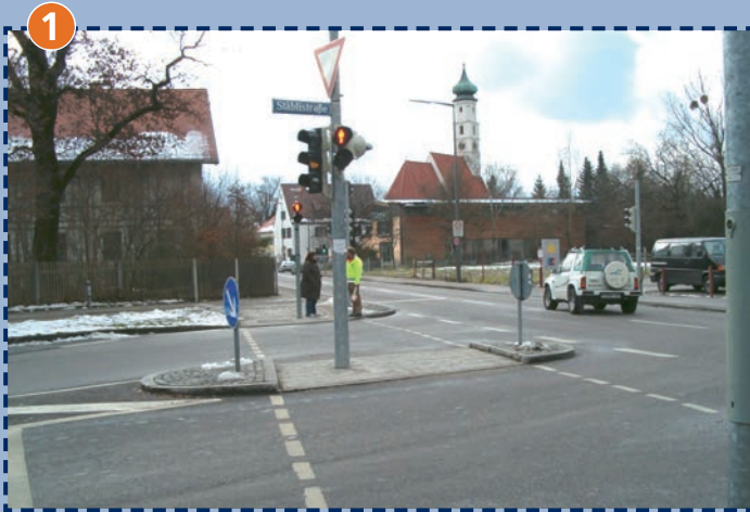
Kreuzung Forstenrieder Allee