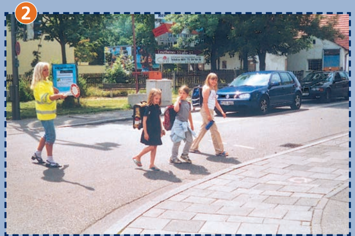
Kreuzung Forstenrieder Allee/Herterichstraße